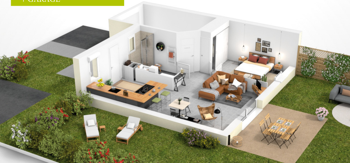
CHEVERNY 2 PIÈCES 55 M 2 + GARAGE