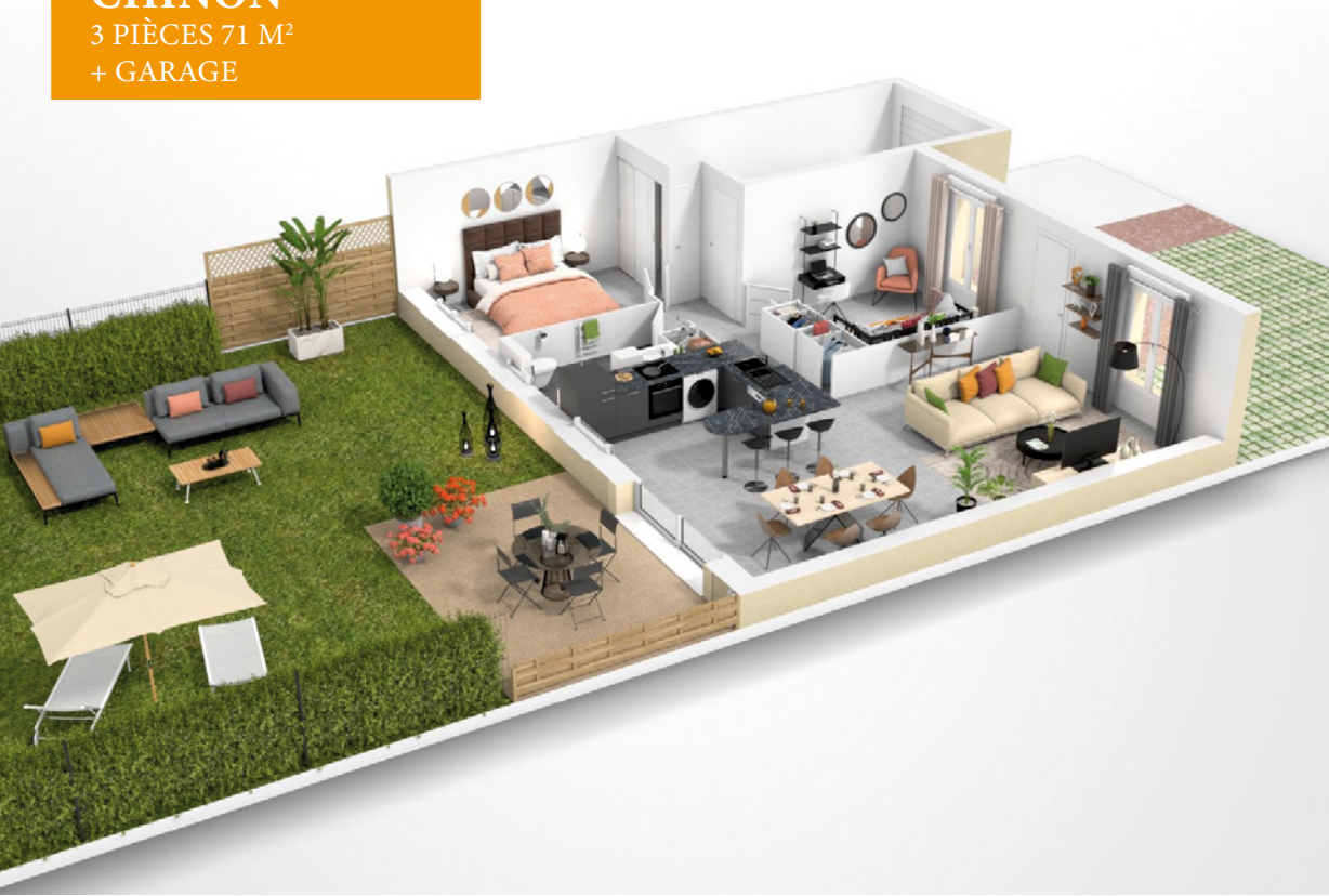
CHINON 3 PIÈCES 71 M 2 + GARAGE