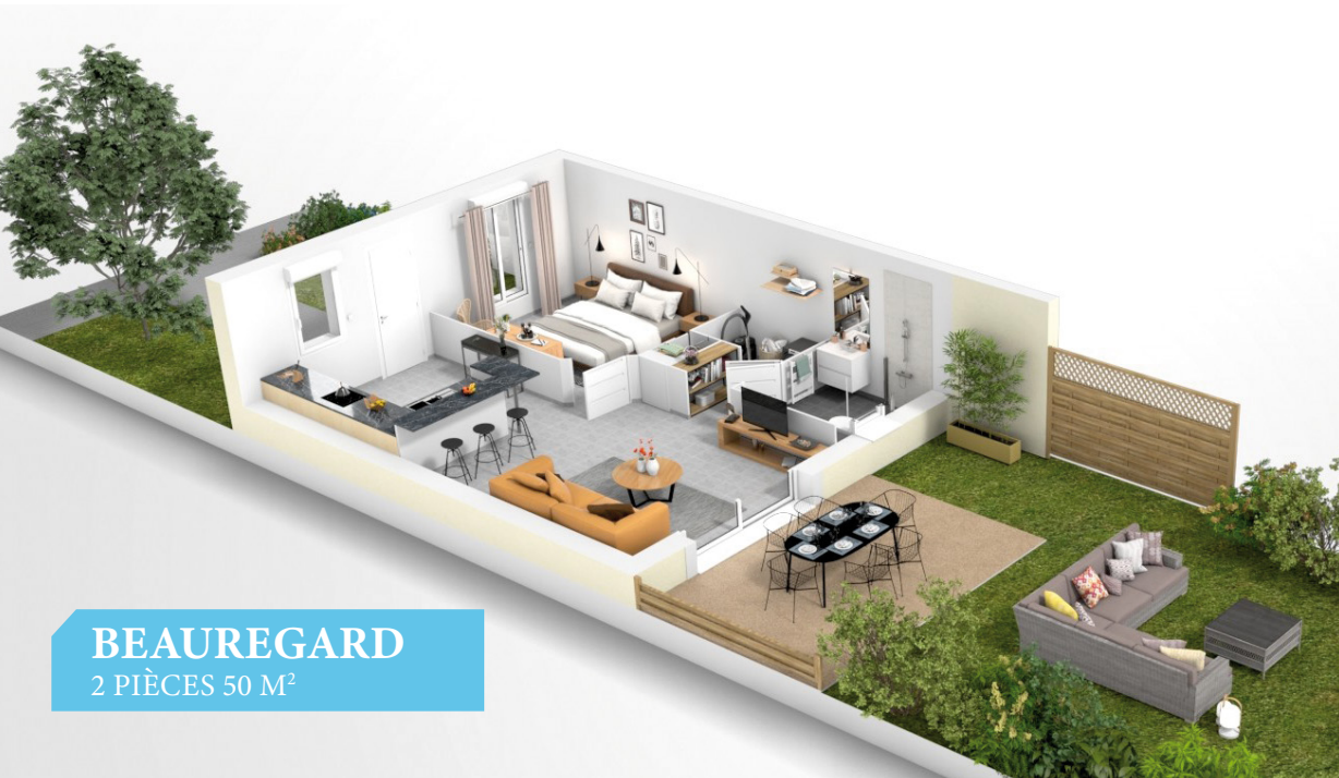
BEAUREGARD 2 PIÈCES 50 M 2