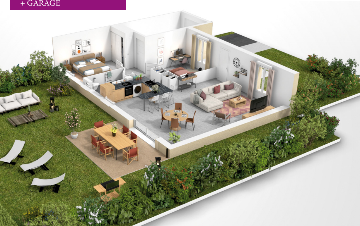
CHAMBORD 3 PIÈCES 83 M 2 + GARAGE