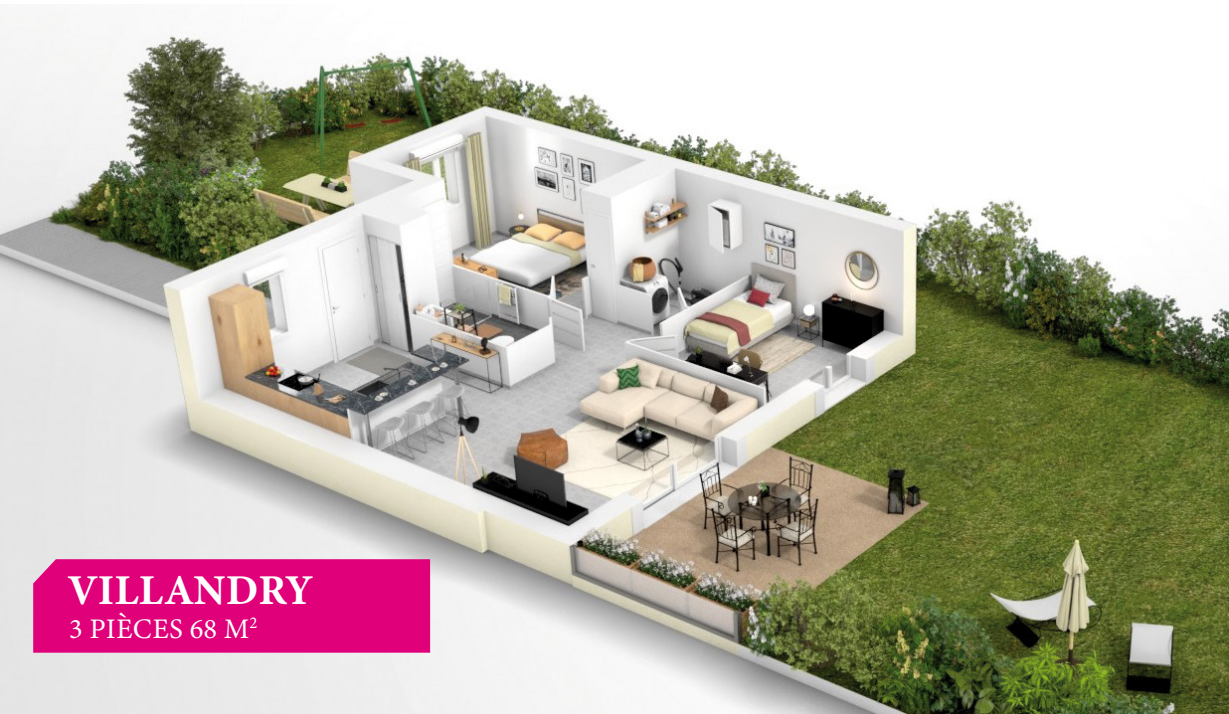
VILLANDRY 3 PIÈCES 68 M 2