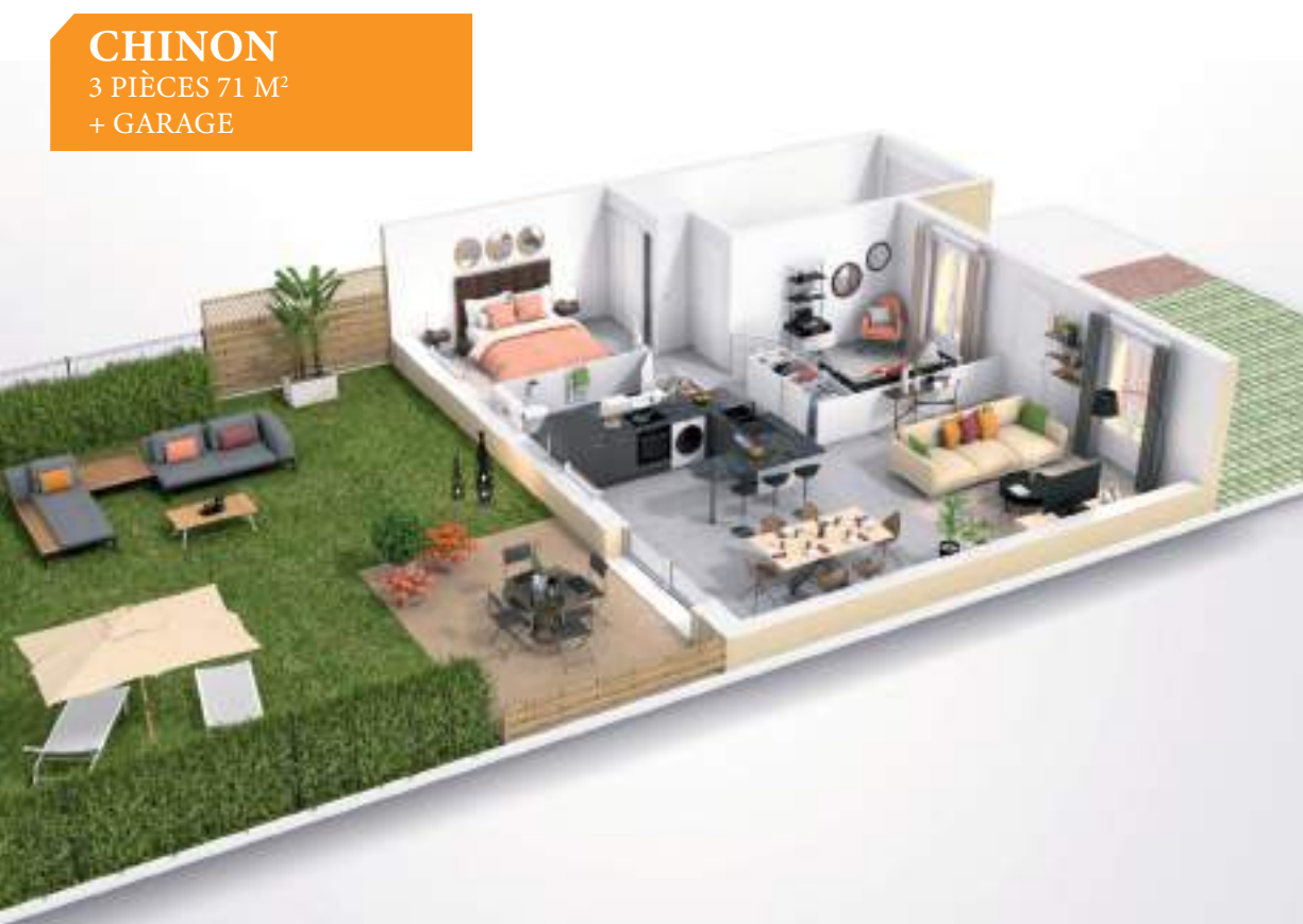
CHINON 3 PIÈCES 71 M 2 + GARAGE

5 modèles clés en main adaptés à vos besoins