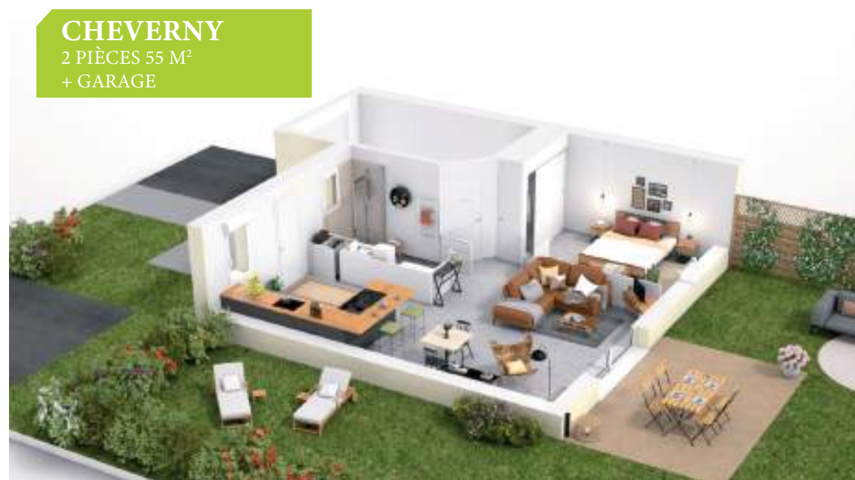
CHEVERNY 2 PIÈCES 55 M 2 + GARAGE