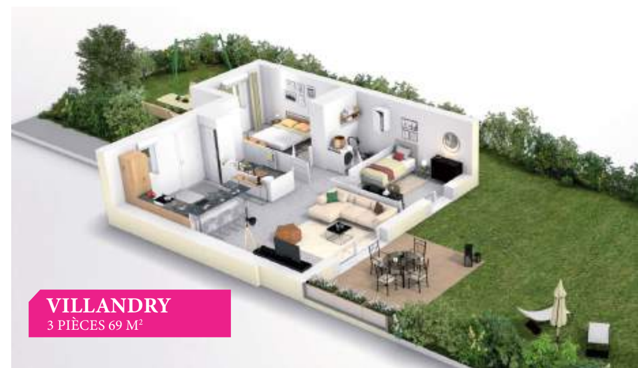
VILLANDRY 3 PIÈCES 69 M 2