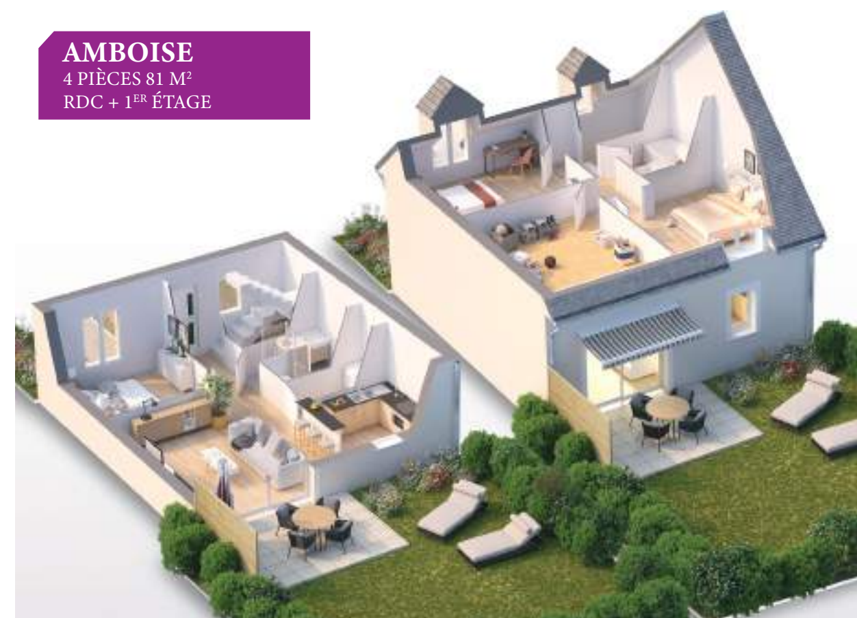
AMBOISE 4 PIÈCES 81 M 2 RDC + 1 ER ÉTAGE

5 modèles clés en main adaptés à vos besoins