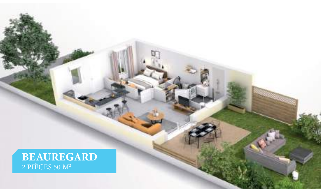
BEAUREGARD 2 PIÈCES 50 M 2